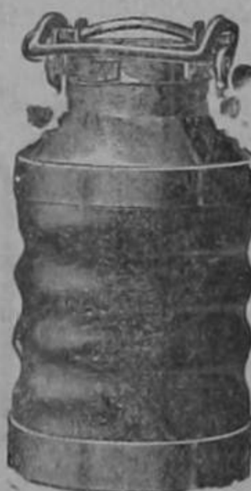
Pinturas Alabastin etc.

CATRES Americanos grandes y pequeños. Felpudos Mangueras alambradas.